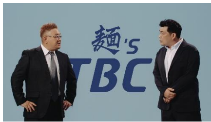
②満足度No.1 メンズTBC ~何メン?篇~