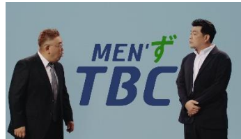
⑥メンズTBCはNo.1 ~脱毛効果篇~