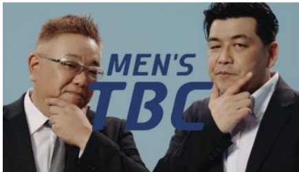
①満足度No.1 メンズTBC ~なんて?篇~

※1 2021年9月MEN'S TBC実施WEBアンケート調査結果、調査対象:20~30代男性443名(メンズエステ・脱毛サロン7社での脱毛経験者)