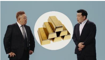
⑤ヒゲ脱毛体験1,000円 篇