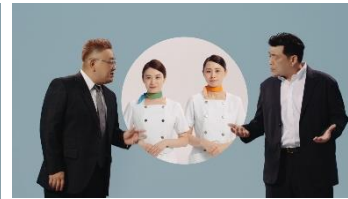
⑦顧客満足度No.1 メンズTBC ~エステティシャン篇~